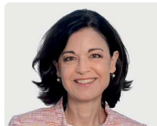
Regine Sauter Nationalrätin FDP ZH

Es braucht diese gesunde Reform. Die einheitliche Finanzierung beseitigt die Fehlanreize im Gesundheitswesen. Sie ist eine über Jahre erarbeitete und sehr breit abgestützte Lösung. Die Zusammenarbeit zwischen Ärztinnen, Therapeuten, Apotheken, Spitex, Spitälern und Pflegeheimen wird verbessert. Die Hausarztmedizin und die Pflege werden gestärkt.