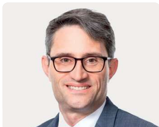
Lukas Engelberger Präsident Gesundheits- direktorenkonferenz