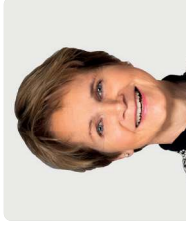
Brigitte Häberli-Koller Ständerätin Die Mitte TG

Mehr Koordination! Das Silodenken führt zu einer teils unkoordinierten Über- und Falschversorgung. Darunter leiden die Patientinnen und Patienten.