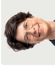
Ursula Zybach Nationalrätin SP BE